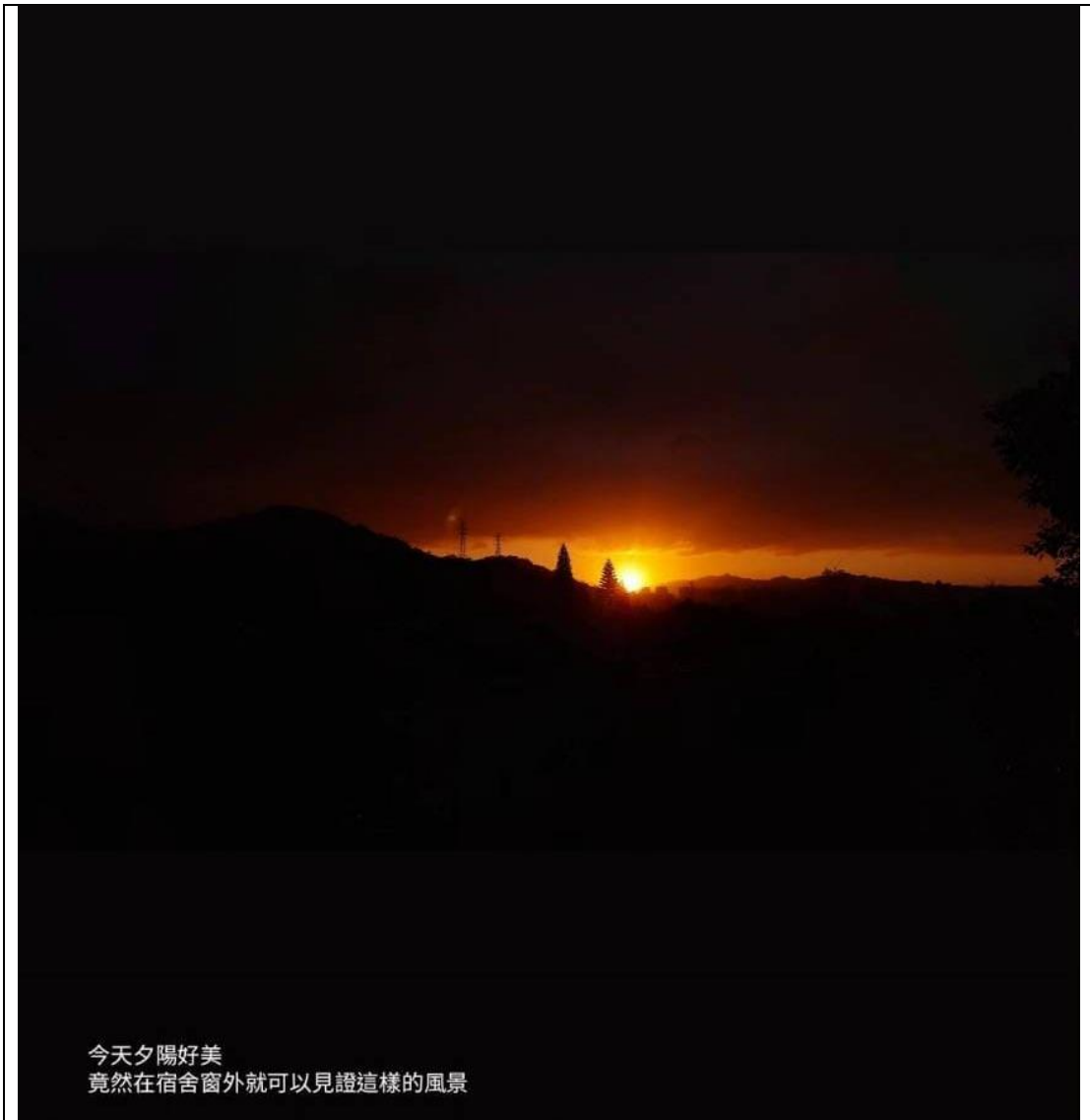
今天夕陽好美 竟然在宿舍窗外就可以見證這樣的風景

這學期只修 16 學分，覺得修少許的課程，並且大量到多元的課堂旁聽會是不錯的策略。在課堂完整學習下的確得到啟發，但也有太多的體驗是來自於和政大的學生互動而來。原本交換來此，打算修讀技術相關的課程，但思量期中期末負擔後作罷，後來卻和意外認識到的同學一起拍 MV，觀摩通告單長怎麼樣、行程安排、取鏡分工，參與了一次影像構思到產出的流程。都是在課堂外的學習。