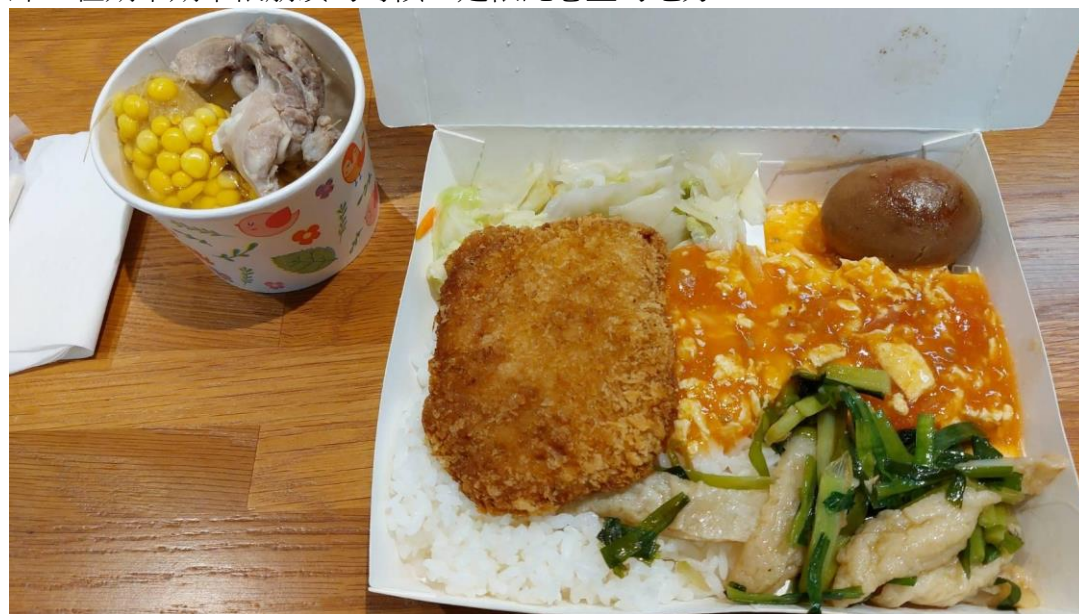
這樣 80 塊，湯裡還能撈到排骨

另外，雖然山上看起來生活機能不便，但是安九食堂卻已經足以讓人生活，自助餐的菜快打烊時間去買的時候，老闆會幫你加好加滿，自助餐隨便你喝的湯不只是單純的紫菜湯，裡面還可以撈到排骨肉；深夜可以買到鹹酥雞跟煉乳饅頭，安九雜貨店不僅賣電池賣便條紙賣宵夜應有盡有，凌晨一點才打烊，在期中期末很崩潰的時候，是依託心靈的地方。